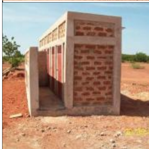
Les douches sont pratiquement achevées