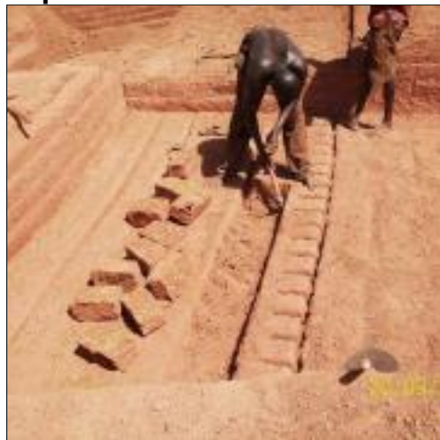
Extraction des blocs de latérite